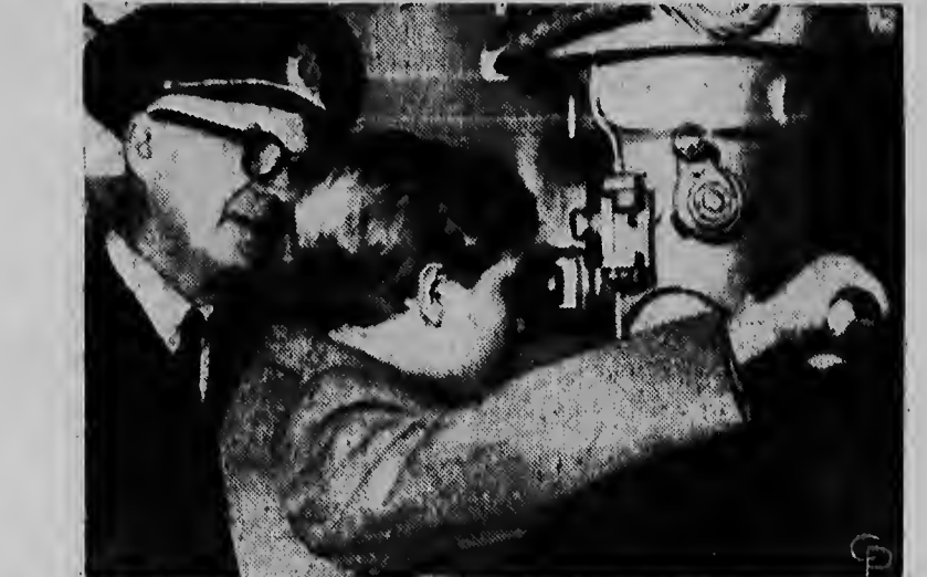
Zweden Kroonprins Carl Gustaaf heeft een bezoek gebracht aan een vliegtuigtentoonstelling in Stockholm, waar hij grote belangstelling aan de dag legde voor een periscopio van een onderzeeër. De tentoonstelling werd gehouden ter gelegenheid van het 50 jarig bestaan van de Zweedse onderzeeër-dienst.

HAMBURG, 15 Feb. — Volgens scheepvaartkringen in Hamburg is de Griekse reden Onassis bereid 45 tank-schepen, die tezamen ongeveer 1 miljoen ton meten, aan Saoedi Arabie te verkopen. Dit zou dan in de plaats komen van het betwiste verdrag tussen Saoedi Arabie en Onassis.